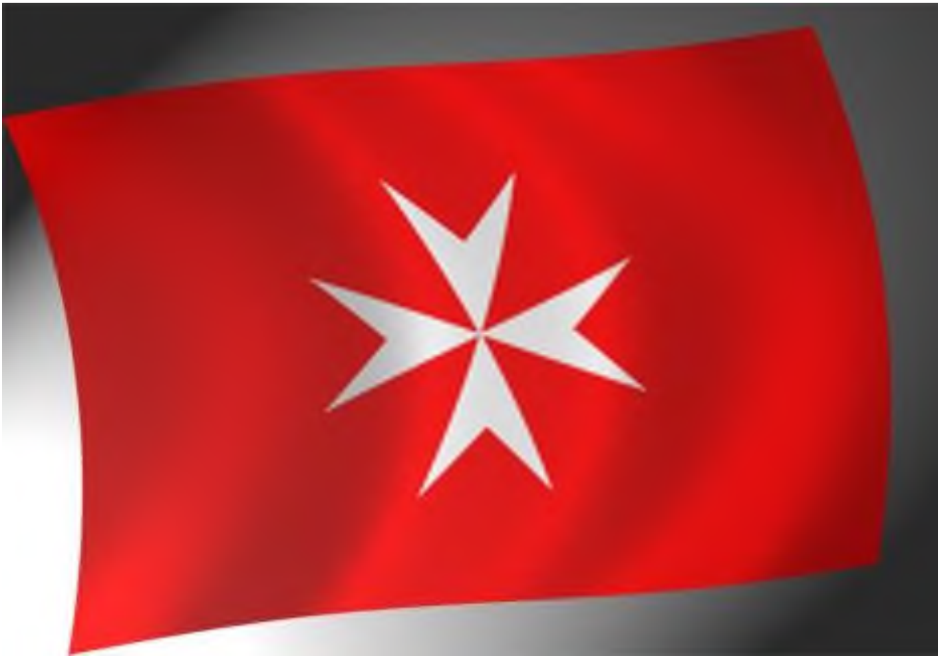
Флаг госпитальерского ордена