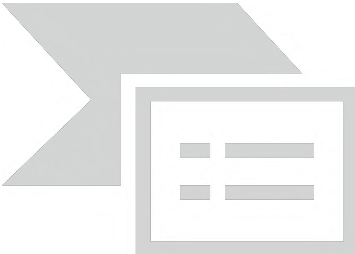
Схема. Коррекционный курс для учеников с ЗПР

Обязательным условием овладения программой коррекционной работы обучающимися с ЗПР является систематическая специальная психолого-педагогическая и социальная поддержка коллектива учителей, родителей, детского коллектива и самого школьника. Психолого-педагогическая и социальная поддержка предполагает: помощь в формировании адекватных отношений между ребенком, одноклассниками, родителями, учителями; работу по профилактике